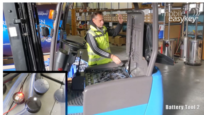
Warnung durch rote LED am Elektrolytsensor