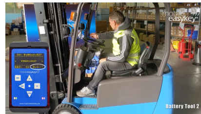
Warnung durch Display-Anzeige am Modul modular plus