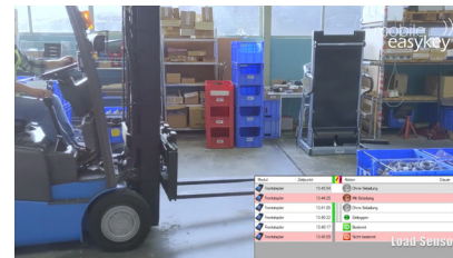
Das Abladen erzeugt einen weiteren Eintrag, wiederum mit Zeitstempel