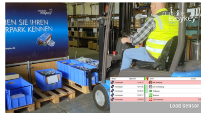
Sensor erkennt Ladung: Eintrag ins Logbuch